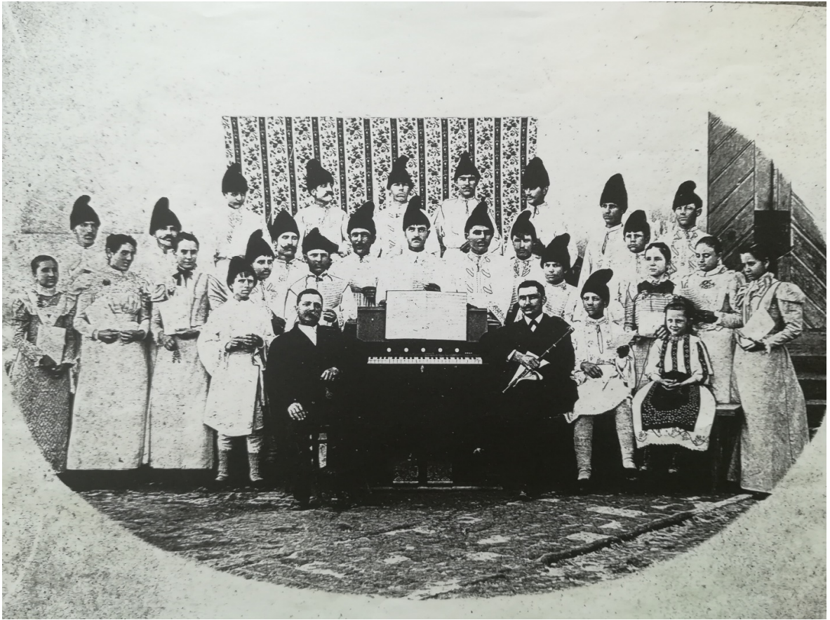
Mešoviti rumunski hor