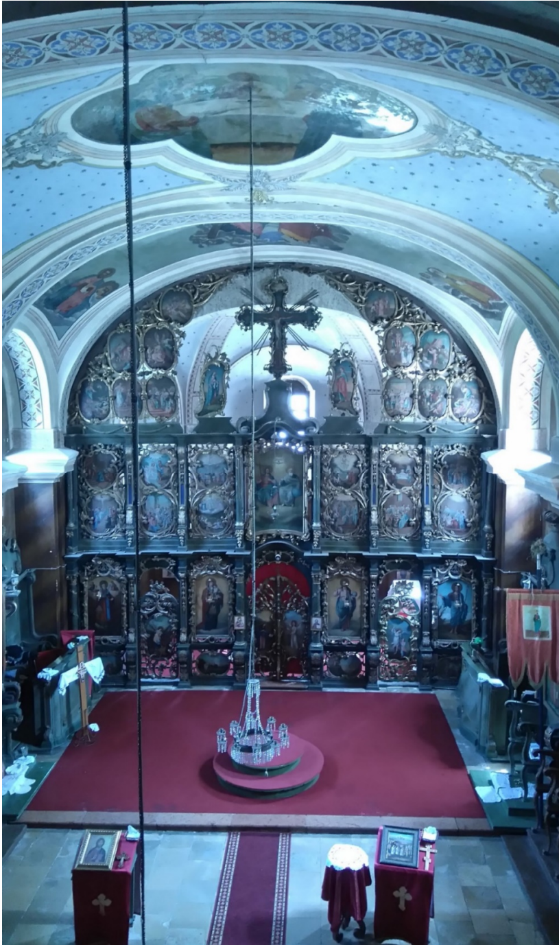
Ikonostas srpske crkve Svetog oca Nikolaja pod zaštitom je države